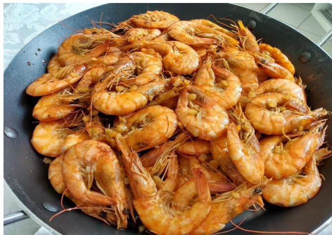
FIGURA 6 – CAMARÃO ALHO E ÓLEO

Muito encontrado no litoral cearense, o camarão é hoje também criado em fazendas de carcinicultura. Os indígenas cearenses preparavam-no das mais diversas formas: moqueado, cozido, assado e salgado para melhor conservação. O camarão na cozinha cearense é servido das mais variadas formas, sendo o ensopado e o frito as técnicas mais comuns. (ROCHA, 2003)