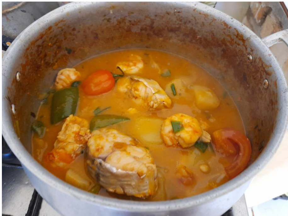
FIGURA 4 – PEIXADA CEARENSE

A Peixada Cearense é o prato mais emblemático servido nos restaurantes das beiras de praia, tanto em Fortaleza como nos outros municípios praianos do Ceará, esse peixe cozido no leite de coco com batata, repolho, pimentão, cebola, alho e pimentas variadas e bastante coentro e cebolinha, é muito apreciado por todos, e hoje em dia, encontra-se uma certa dificuldade de encontrá-lo da sua forma mais original, respeitando as tradições e servido com o pirão de mandioca. Ver se nessa preparação a tradição portuguesa dos cozidos com o sabor do coco trazido de outras plagas e a contribuição fenomenal das diversas pimentas tão utilizadas pelos indígenas. Os peixes mais utilizados para que a peixada seja bem tradicional são a Arabaiana, o Pargo e a Cioba, não deixando aqui de acrescentar que nos lugares onde se tem um bom açude ou rios abundantes pode-se ser feita com Tilápia, Curimatã ou outro peixe de água doce, sendo assim chamado de peixe na água grande. (ROCHA, 2003)