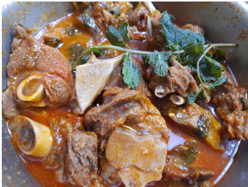
FIGURA 9 – CARNEIRO GUISADO

“Sabor rebuscado, dedicado aos prazeres não menos nobres da degustação... O seu preparo é um verdadeiro exercício de habilidades manuais”.