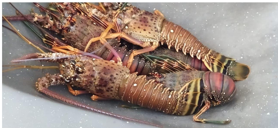
FIGURA 5 - LAGOSTA

Pescadas pelos povos tradicionais nas locas de pedras que ficavam à beira mar, tal era sua abundancia as lagostas capturadas com as mãos ou flechadas com muita facilidade são hoje um dos pratos mais sofisticados e requisitados da Gastronomia cearense. De grande importância para a economia do Ceará, ela sofreu um revés com a pesca predatória, mas com o período do defeso veio uma veia de esperança na recuperação dessa pesca tão valiosa. A lagosta ainda pode ser servida com alcaparras, vinagrete, na manteiga e ao thermidor. (ROCHA, 2003)