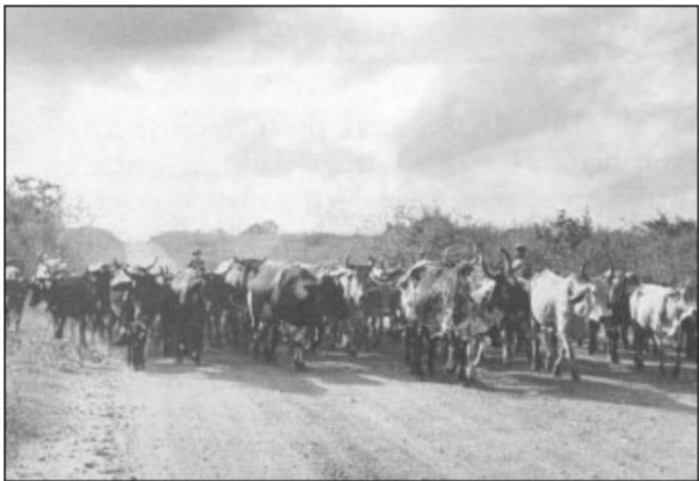
FIGURA 2- As boiadas abrem caminho no sertão

escravidão ou “livres” em aldeias. O gado virou moeda de troca e ao redor dos pequenos rios iam surgindo fazendas com seus currais, nesse contexto surge uma figura muito conhecida no Ceará “o vaqueiro”, que se torna o principal desbravador do sertão e empregado importante para os fazendeiros. As charqueadas feitas com os rebanhos abatidos na região do Aracati e Acaraú formaram a primeira atividade industrial do estado, trazendo grande riqueza para a região e se tornando referência para o Brasil na salga das carnes bovinas. (Casa Militar do Governo do Ceará, 2010)