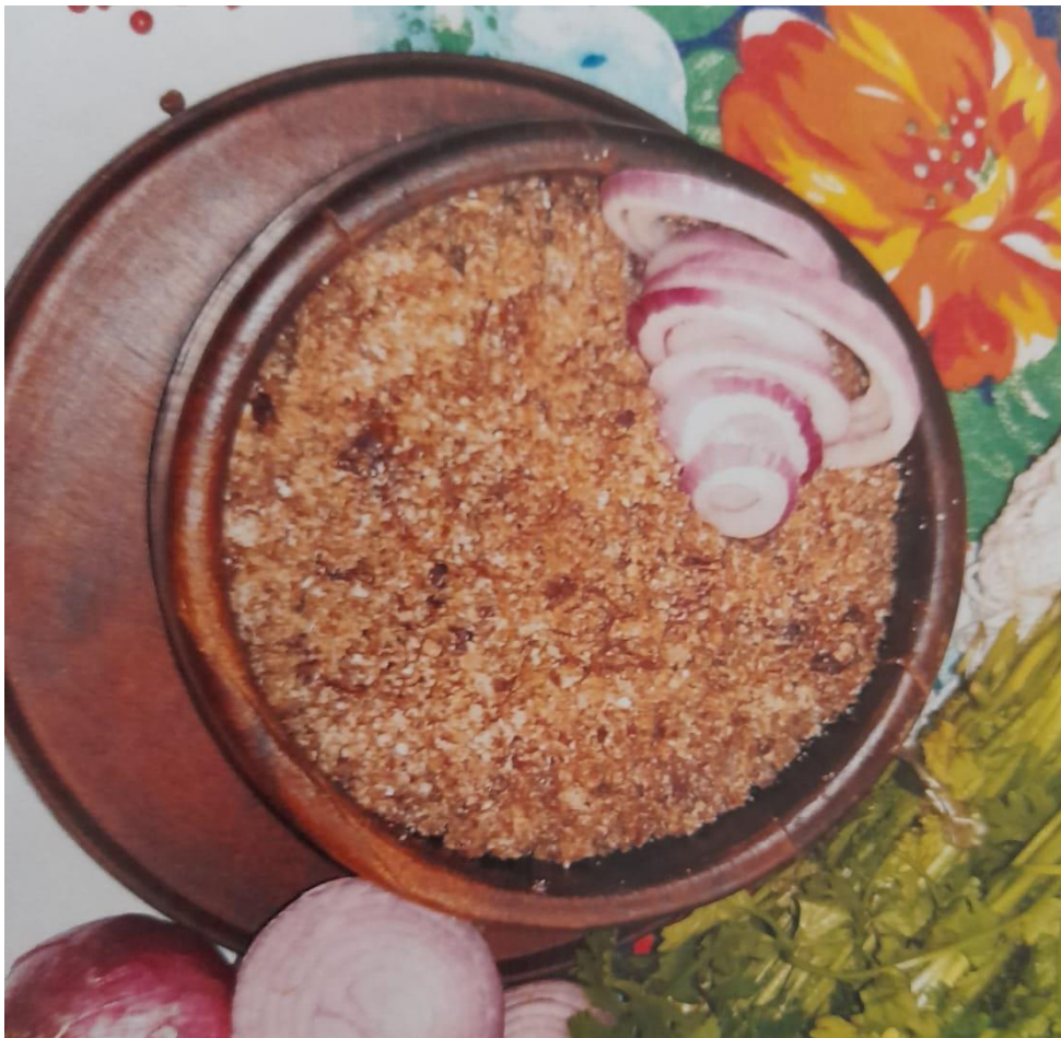
FIGURA 8 – PAÇOCA

“A paçoca acompanha o cearense desde os primeiros tempos do povoamento do sertão. Sem molhos, sem requintes culinários, é, afinal, um prato que se transporta até dentro de um saco de papel ou, mais protegidamente, dentro de uma lata com tampa”.