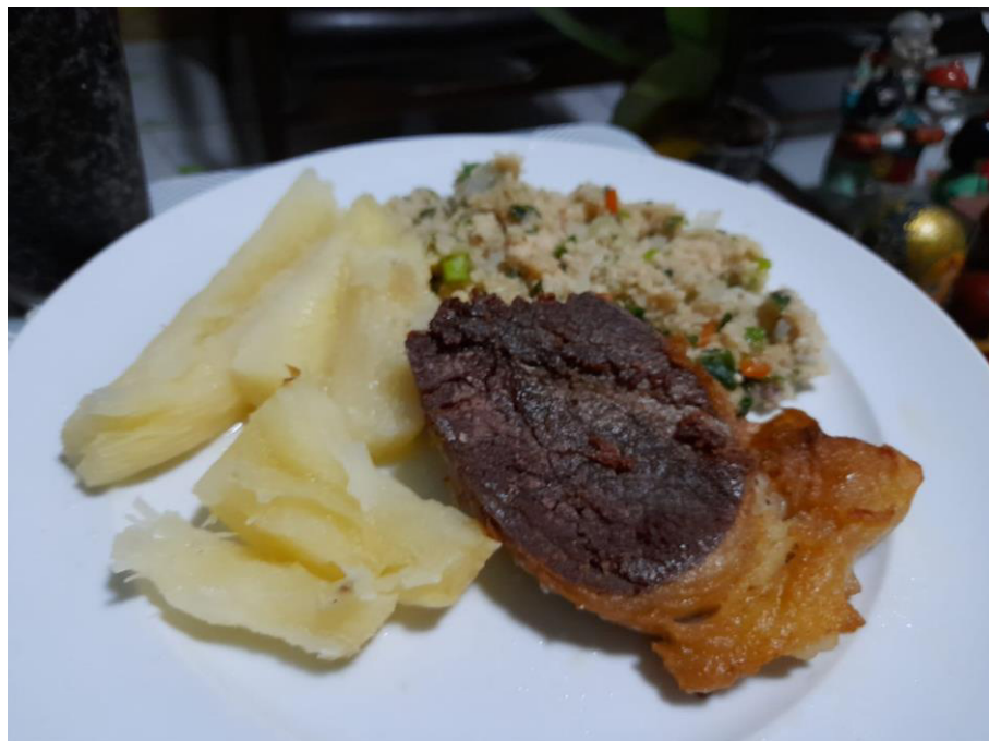
FIGURA 7 – CARNE DO SOL ACOMPANHADO DE MACAXEIRA

sol ou carne seca, tem sua história profundamente ligada ao Ceará, principalmente à região do Aracati, que possuía ainda nos Séc. XVIII e XIX um porto de grande movimento, e recebia das fazendas do Icó e redondezas, o boi para ser abatido e salgado. Hoje a Carne de Sol é servida, dependendo da técnica de preparação, nos mais diversos tipos de restaurantes, indo dos mais populares onde é servida assada, com macaxeira, rapadura, queijo coalho, aos mais sofisticados onde após passar por técnicas de cura onde o sal é utilizado na menor quantidade possível e após é confitada em baixa temperatura ou assada no forno e acompanhadas de musselines e purês de legumes. (SILVA, 2005)