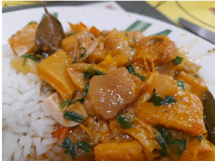
FIGURA 10 – PANELADA